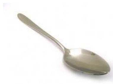
KA - OTE