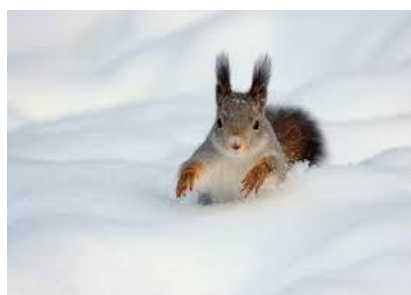
VĀVE - E