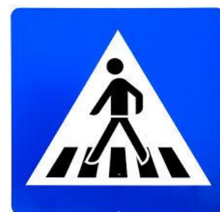
PĀ - EJA