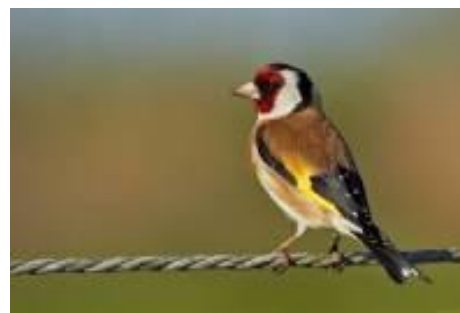
da - ītis