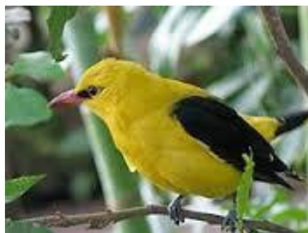
vālo – e