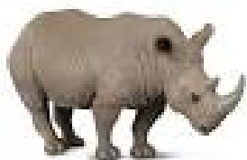
degunra - is