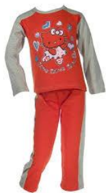
pi - ama